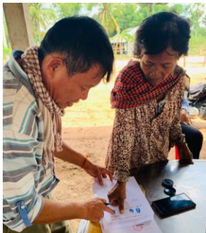
សកម្មភាពនីតិវិធីប្រគល់-ទទួល