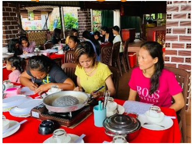
សកម្មភាពបំពេញទម្រង់សមាជិក