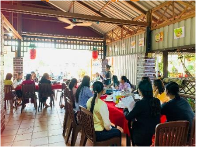
សកម្មភាពបទបង្ហាញការងារសែន