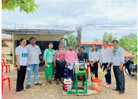
បង្កើតមុខរបរខ្នាតតូច