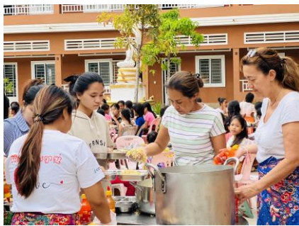
ផ្តល់អាហារ