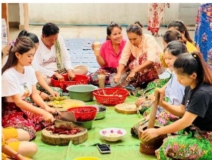
រៀបចំអាហារ