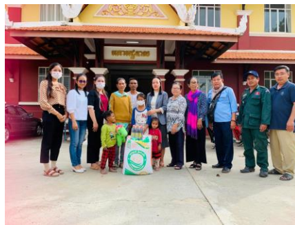
សកម្មភាពដៃគូបញ្ជូនកុមារីរងគ្រោះ