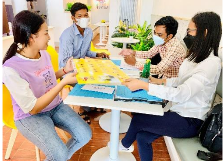
ជាមួយការងារ